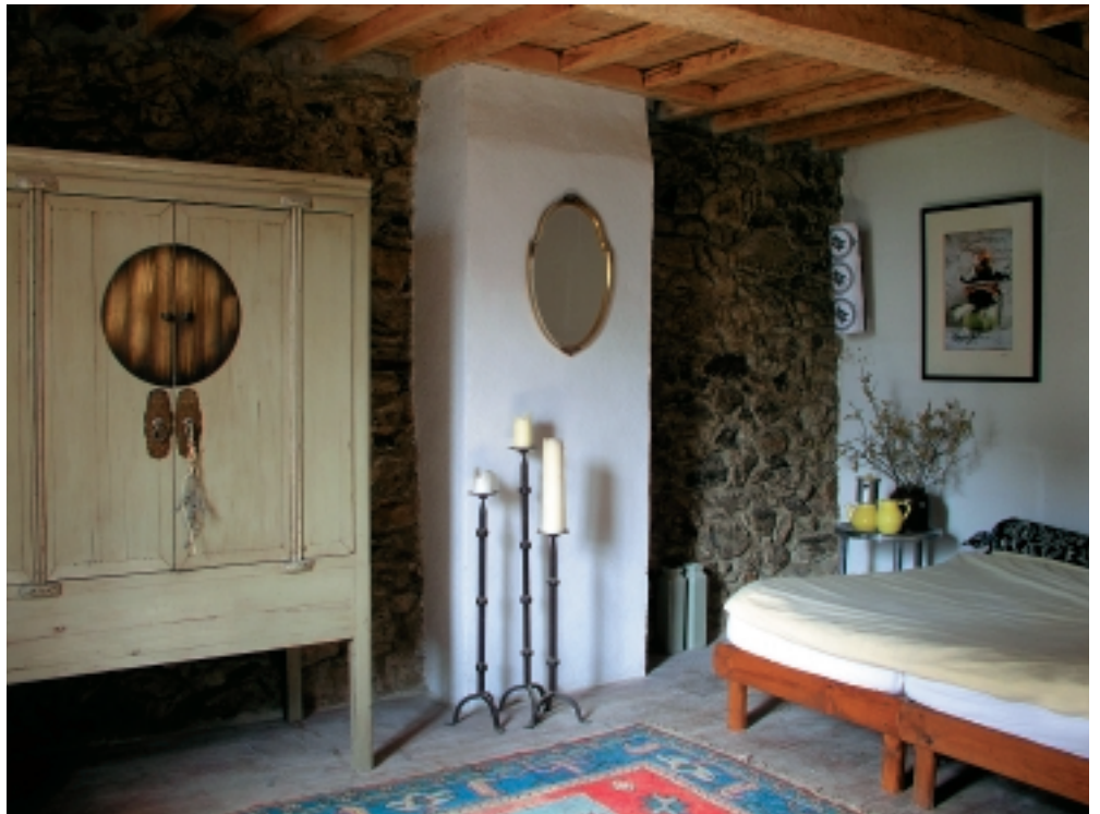
De gezellige tweepersoons chambre 'Montcalm' op de eerste etage.