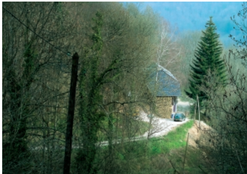
Aan het einde van de 'oprijlaan' van 700 meter... Bourgaille!