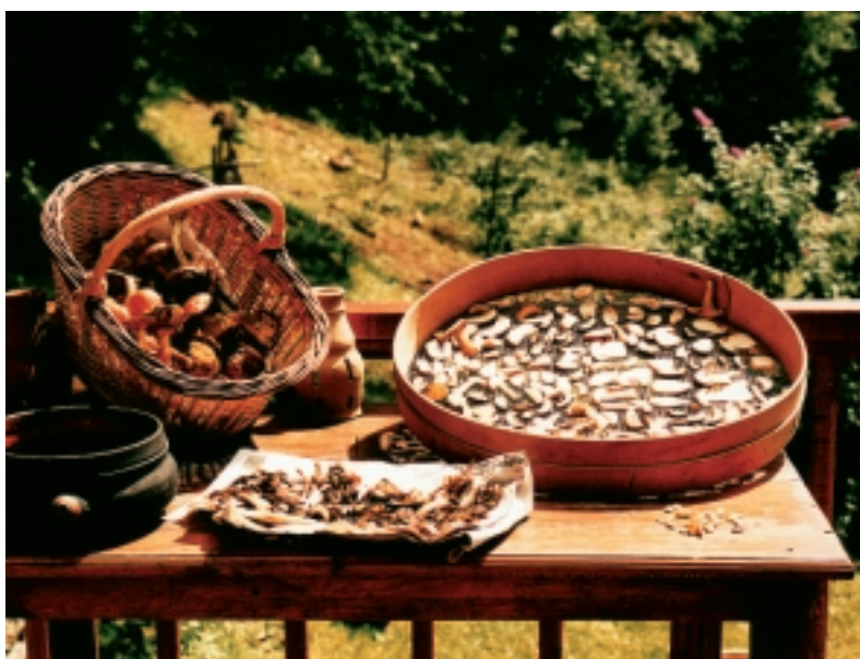
Een rijke oogst paddestoelen van eigen terrein.