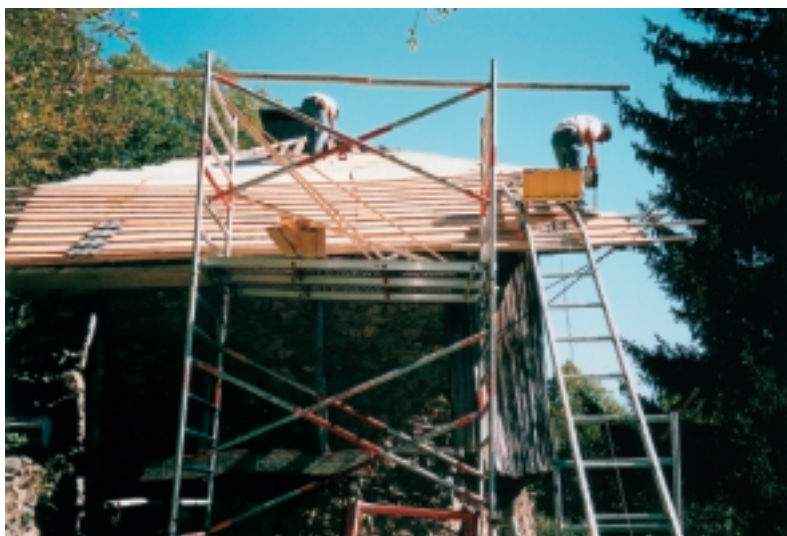
De Franse dakdekker kan goed uit de voeten op onze Haarlemse steiger.